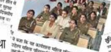
अयोध्या। भोजनपाल विश्वविद्यालय में साइबर सुरक्षा कार्यशाला का तीसरा चरण संपन्न हुआ।