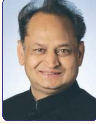
श्री अशोक गहलोत मुख्य मंत्री, राजस्थान

मुझे यह जानकर प्रसन्नता है कि मोहनलाल सुखाड़िया विश्वविद्यालय, उदयपुर द्वारा इस वर्ष के शैक्षणिक सत्र से विश्वविद्यालय के त्रैमासिक न्यूज लेटर 'उदयप्रभा' का प्रकाशन प्रारम्भ किया गया है और इसका आगामी अंक जनवरी से मार्च, 2022 की गतिविधियों पर आधारित होगा।