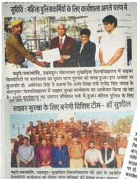
सुविवि: महिला पुलिसकर्मीयों के लिए कार्यशाला अगले चरण में