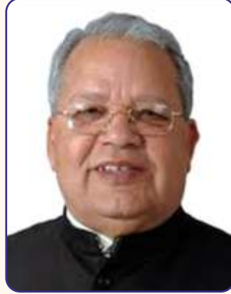
श्री कलराज मिश्र राज्यपाल, राजस्थान

मुझे यह जानकर प्रसन्नता हुई है कि मोहनलाल सुखाड़िया विश्वविद्यालय द्वारा त्रैमासिक वार्तापत्र के तीसरे अंक का प्रकाशन किया जा रहा है।